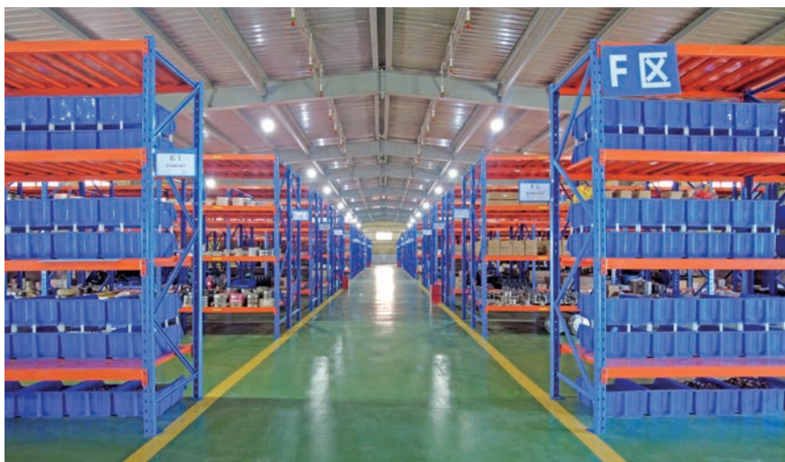
中色刚波夫智慧仓储

科研与人才建设齐头并进，2025年度，中色刚波夫拟荣获4项省部级科技奖励（其中一等奖2项、二等奖2项），