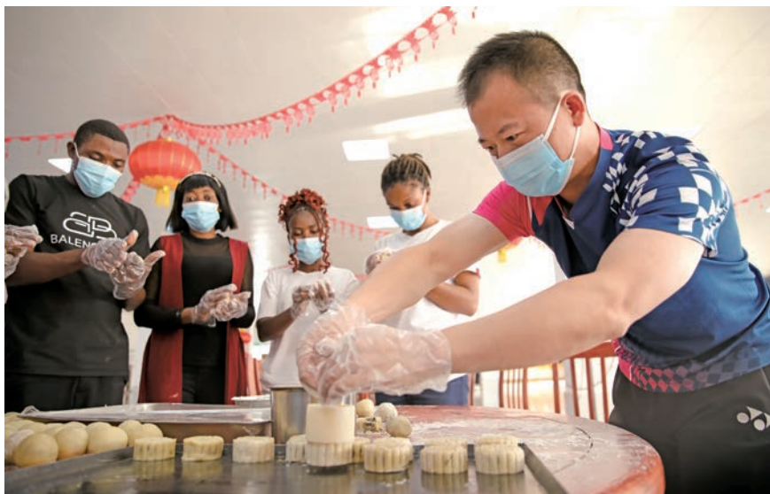
中刚员工共同制作月饼