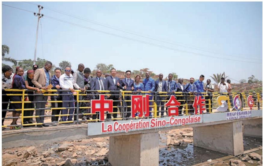
基韦韦桥梁移交现场

在促进当地就业方面，公司积极为当地居民提供就业机会，1 000余个就业岗位有效缓解了当地的就业压力。同时，公司还注重对当地员工的培训和培养，通过开展职业技能、安全知识等培训，提高了当地员工的综合素质和就业能力，为当地人才培养和经济发展作出了贡献。在推动当地基础设施建设方面，公司除了建设上述社会责任项目外，还积极参与当地其他民生建设，改善了当地的生产生活条件，