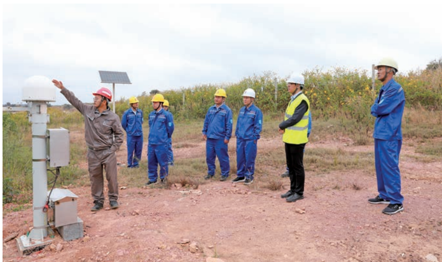
尾矿库在线监测系统投入使用