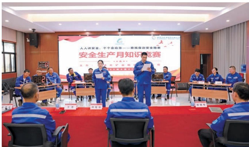
安全生产月知识竞赛

重点项目建设是公司扩大产能、提升竞争力的重要支撑。2025年, 多个重点项目稳步推进, 为中色刚波夫的