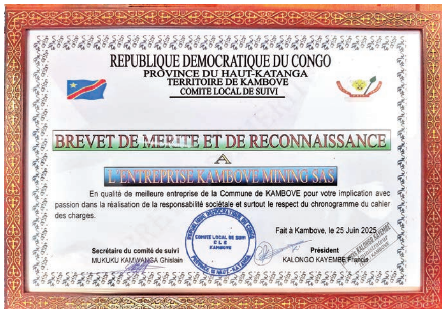
中色刚波夫获刚果（金）坎博韦地区授予的社会责任“特殊贡献奖”