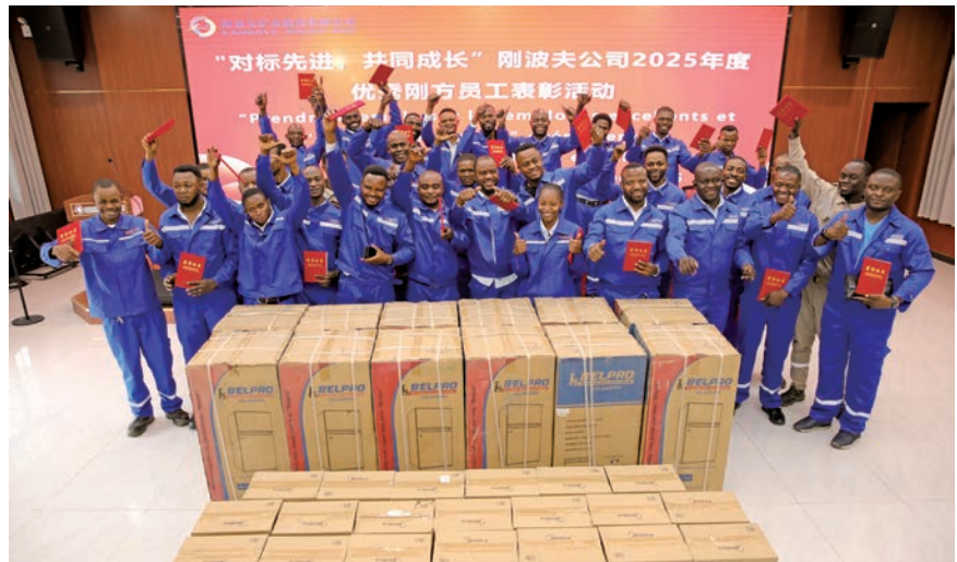
2025年度优秀刚方员工表彰

隐患排查治理工作扎实开展，公司制定了科学合理的年度隐患排查工作计划，全面覆盖综合性、季节性、专业性等多类别隐患排查治理。严格落实隐患“排查一整改一销号”全过程闭环管理机制，每个环节责任到人、流程可控。全年共排查各类安全隐患790项，完成整改757项，隐患整改完成率达95.8%，较2024年提升2.8个百分点。工作中呈现出“三强”特点：隐患排查力度覆盖所有生产经营环节与重点部位，无排查盲区；问题发现能力通过多类别、高频次检查，精准识别显性与隐性隐患；整改推进力度通过建立隐患整改台账，明确整改责任、时限与措施，定期跟踪督办，排查整改